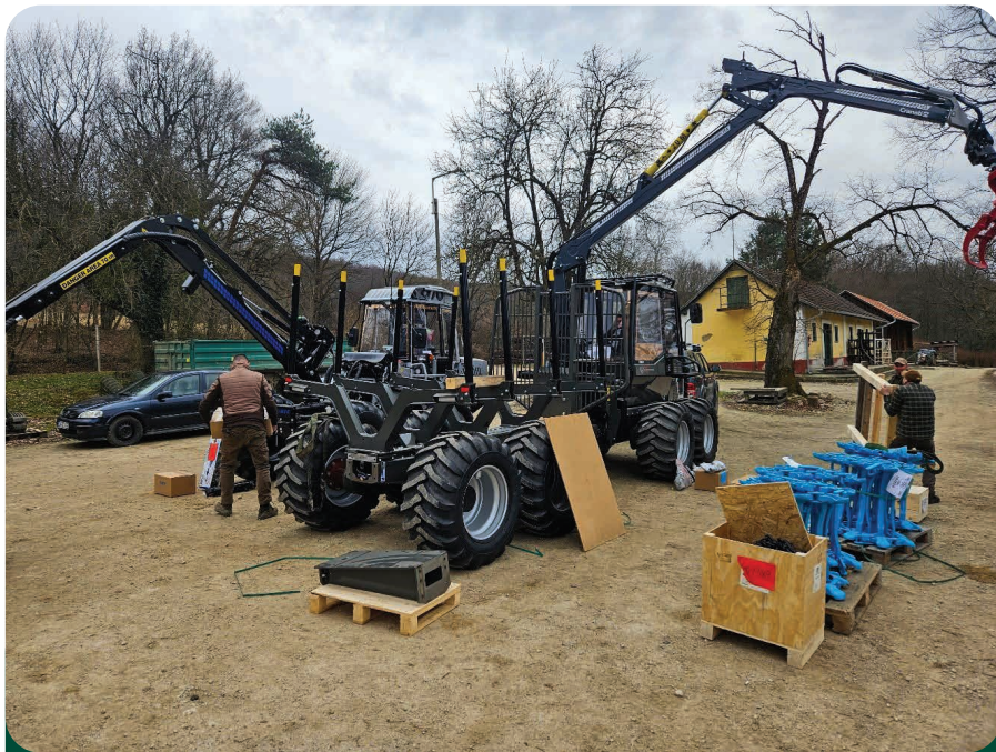
Vimek gépek átvétele a Bánokszentgyörgyi Erdészet szentpéterföldei telephelyén