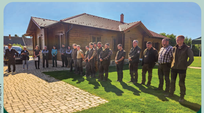
A rendezvény résztvevői

Gróf Jácint vadgazdálkodási osztályvezető