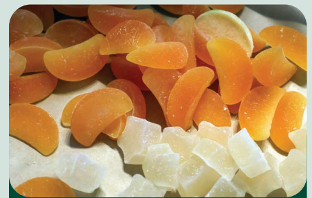
Citrusos, pihe-puha házi gumicukrok

„Tavasszal több megrendelés érkezik az édességekre, ősszel és télen inkább festek – magunknak, a családnak és a barátoknak. Ehhez persze kell a megfelelő hangulat és az ihlet is. De ugyanez érvényes a pillecukor-kreációimra is. Ezekkel legszívesebben