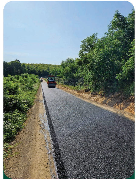
AC 11 aszfalt kopóréteg beépítése a Liszói feltáróúton

telezés a MAORT-út Tormafölde felé eső, közel 3,5 kilométeres szakaszán, ahol a burkolatfelújítás mellett komplett vízelvezetés-rekonstrukció, pályaszélesség-növelés és a teherbírás növelését célzó alépítmény-erősítés valósul meg több mint 200 millió forintos beruházás keretében. Jó ütemben halad a teljesen új nyomvo-