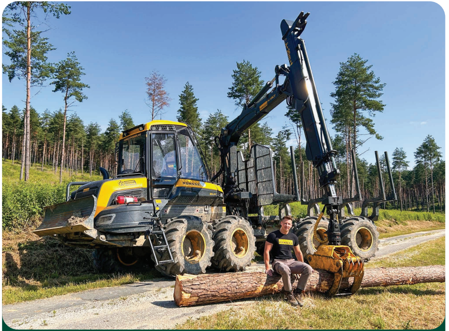
Laci a forwarderrel – a cikk kedvéért beállított környezetben

A fakitermelés fő időszaka a tél, a mun-