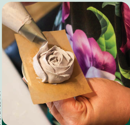
Így készül a rózsa

„A családom és a barátaim az 50. születésnapomra megleptek egy grillázstanfolyamra szóló utalvánnyal, itt kezdődött minden. A stúdió, ahova ez szólt, számos egyéb hobbicukrász-tanfolyamot indít rendszeresen, ott láttam meg sok olyan munkát, amelyek tetszettek, és már akkor eldöntöttem, hogy nem állok meg a grillázsnál. Így is lett, elvégeztem a pillecukor-és a gumicukor-készítő tanfolyamot, idén szeptemberben a francia desszertek, októberben pedig a mindenmentes desszertek következnek.”