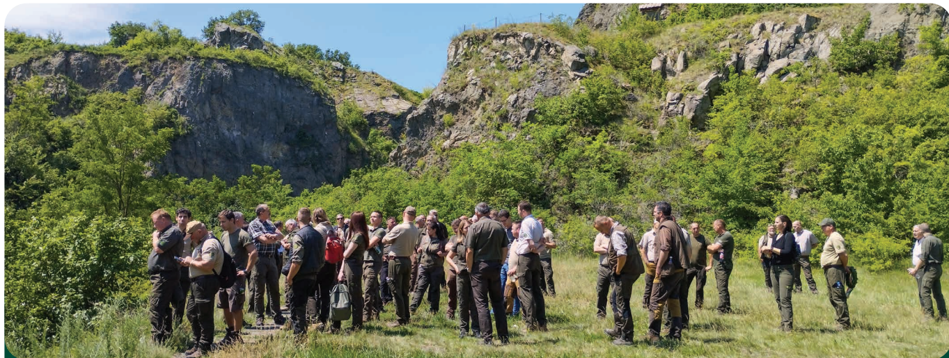
A Ság hegy kráterében