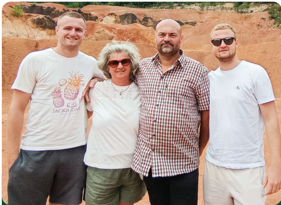
A mai napig együtt nyaral a család, leginkább az Alföldre és a Balatonhoz szeretnek utazni