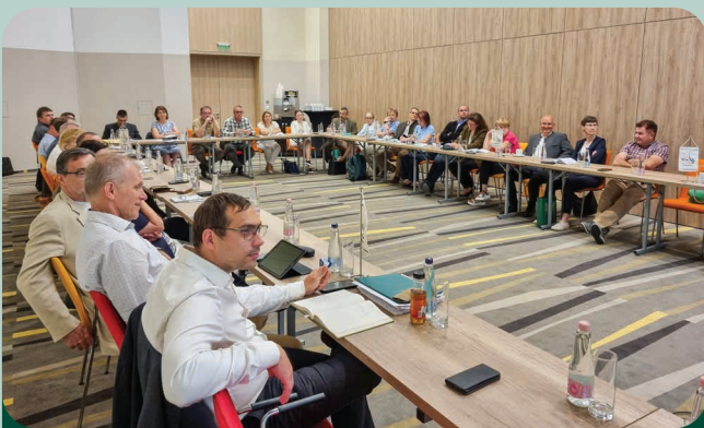
A konferencia hallgatósága

Az esti kötetlen beszélgetés, valamint másnap a Balaton-felvidéki Nemzeti Park kis-balatoni látogatóközpontja által szervezett túra jó lehetőséget teremtett arra, hogy a hasonló szakterületen dolgozó kollégák nemcsak szakmailag, de emberileg is jobban megismerjék egymást.