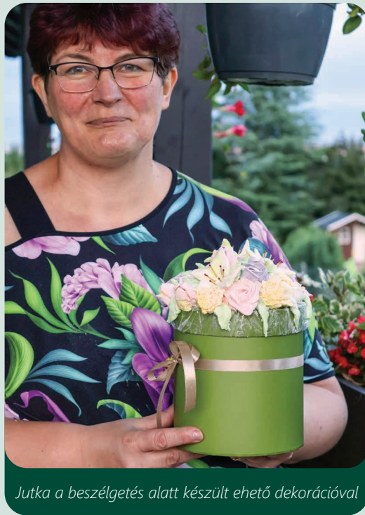
Jutka a beszélgetés alatt készült ehető dekorációval

Mindkét fajta édességet, a pillecukrot és a gumicukrot is meg kell hinteni, előbbit keményítő és porcukor keverékével, utóbbit csak keményítővel, hogy ne ragadjanak