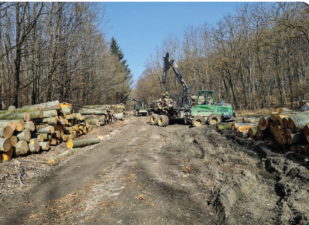
Forwarderek munka közben Szentpéterföldre térségében.

Összességében elmondható, hogy bár a koronavírus-járvány számos nehézséget jelentett és jelent a mai napig, de a sok negatív hatás mellett pozitív hatásai is voltak. Szorosabbá váltak a partnerkapcsolataink. A szomszédos erdőgazdaságok a közös célok érdekében összefogtak. Csak remélni tudjuk, hogy ez az összefogás további