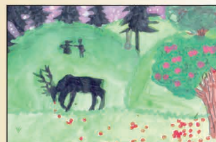
A 2020. évi rajzpályázatunk néhány inspiráló alkotása

A maximum A4-es méretű alkotások készítésénél az eszközök kreatívan használhatók. A hagyományos festései, rajzolási módokon kívül, a környezet tudatosság jegyében csomagoló papírok, fonalak, magok, termések, gyöngyök, ruha- és műanyagok stb. újrahasznosításával készült pályaműveket is várunk.