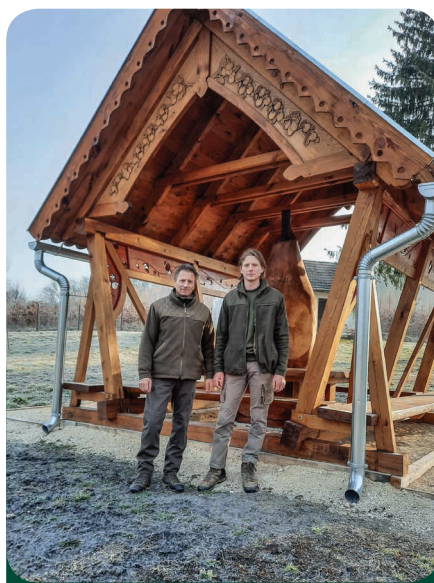
Apa és fia a vétyemi emlékmű előtt.