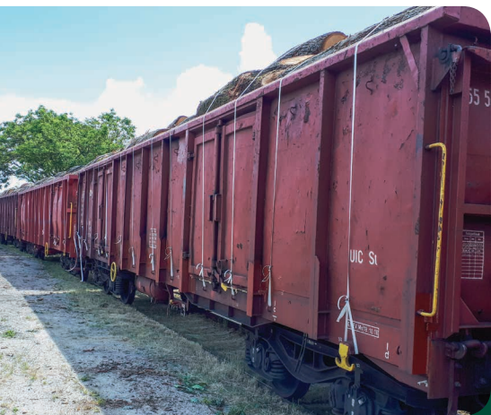
Fantoni irányvonat a nagykanizsai MÁV-rakodón.