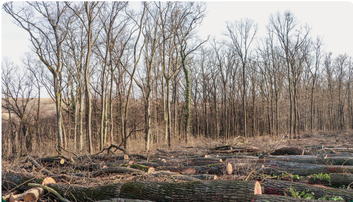
Az előközelített faanyag darabolás és átvételezés után.

A tarvágást a rossz megközelíthetősége valamint a kedvezőtlen időjárás miatt csak februárban tudtuk megkezdeni. A szálfákat vonszolósos előközelítést követően választékolják, majd a darabolást, átvételezést és kapcsolást követően forwarderrel a kerület csaknem 3 kilométer távolságra lévő rakodójára közelítik ki. A rönkféleségeket tehergépkocsikkal a baki nagyrakodónkra szállítjuk – megterítésére csak itt van lehetőségünk –, a többi választékot a kerület rakodójáról igyekszünk értékesíteni. Ebben az erdőszetben ugyan nem nehéz viszonylag egyenes rönkanyagot választékolni, azonban a túlzott göcsösség erősen rontja a dongaröng arányát.