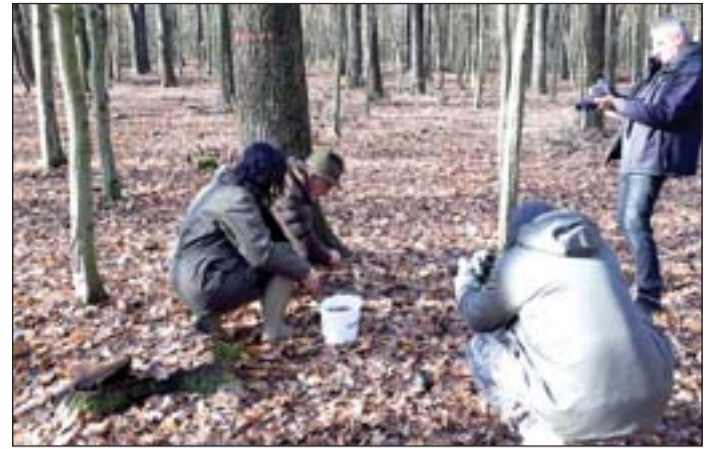
Az új Reviczky-sorozat forgatásán Reviczky Gábor színművész is szedett nálunk némi tölgymakkot