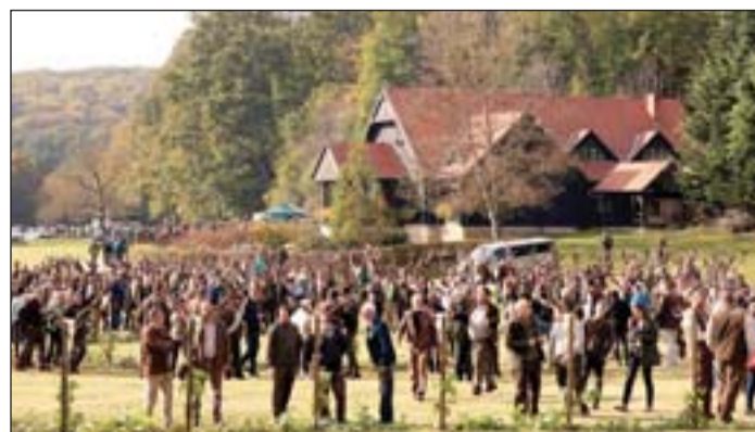
Trófeaszemle – 2019