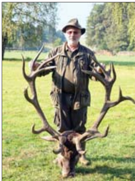
2016 szeptemberében, a Tuskós kerületben elejtett bika. 13,54 kg, 245,43 CIC-pont. Az erdőgazdaság ez évi legnagyobb bikája