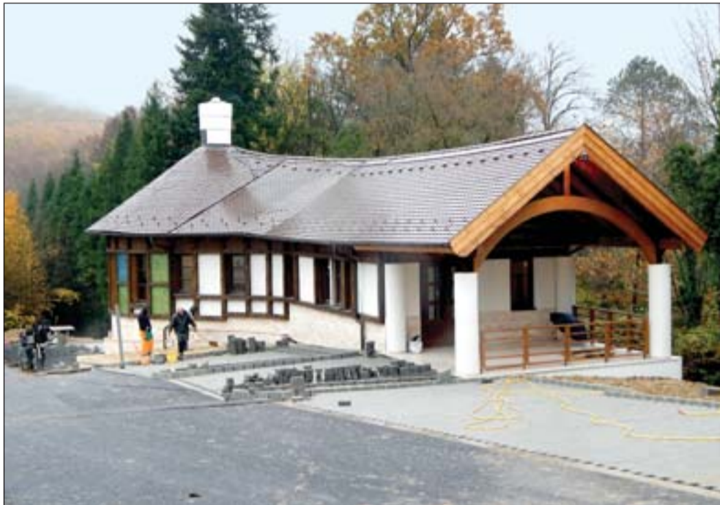
A budafai fogadóépület

megfelelő bükk fő fafajú erdő-részletekre. Látható volt, hogy ilyen fapiaci körülmények között nem lehet cél az éves fakitermelési tervünk túllépése, így minden fakitermelő vállalkozónkat legalább egy hónapra leállítottuk a nyári időszakban. Ezen intézkedéseknek köszönhetően a fennálló értékesítési