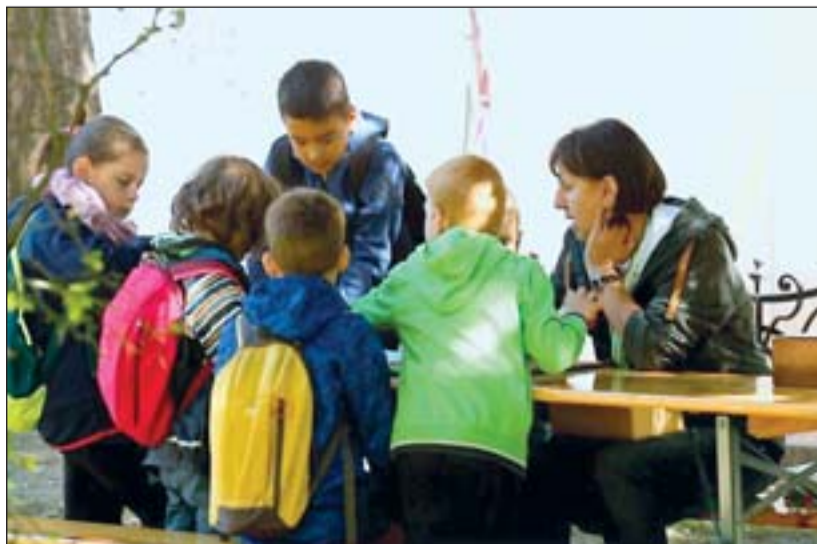
Erdői iskoláink sátrában is nagy volt az érdeklődés