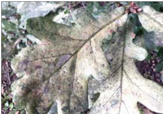
Fertőzött tölgy levelének színe

Délről-délkeletről történő terjeszkedés után Közép-Európába mintegy 7 éve ért el, Magyarország déli vidékein (Dél-