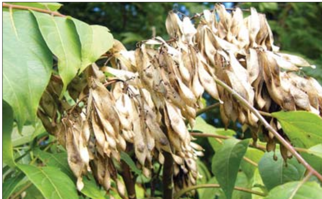
Mindig „megbízhatóan” bő termés a bálványfán

tek adottságaitak legjobban kihasználva, a lehető legjobb válaszokat adva, saját napi tevékenységük során igyekeznek megoldani.