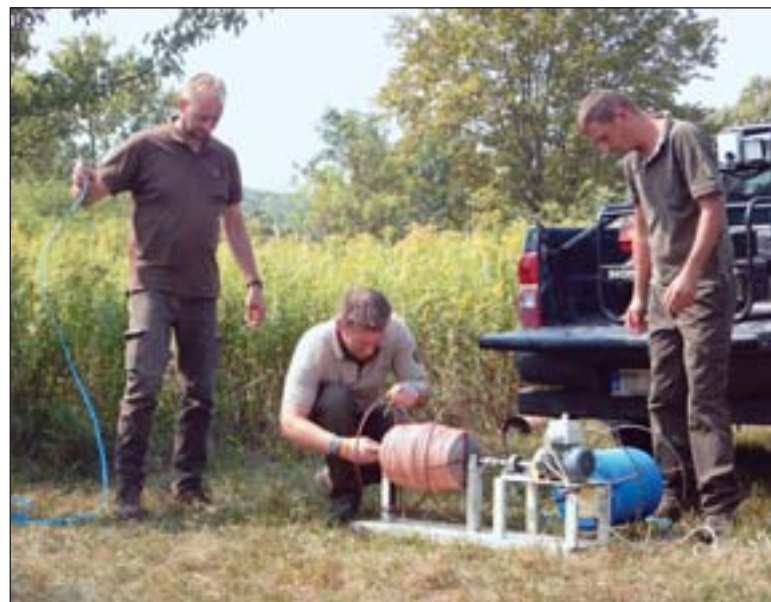
Kollégáink villanypásztor-vezeték bontása közben