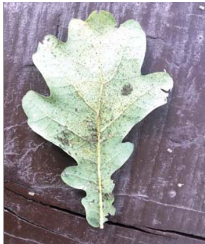
Fertőzött tölgy levelének fonákja. Jól láthatóak a lárvák és a kifejlett rovarok, ill. az ürülécsomók.

általános egészségi leromlás lép fel. Jelenlegi tudásunk szerint közvetlenül nem okozza a fa pusztulását, de kártyavárként döntheti össze a tölgyektől függő, többszáz élőlényfajból álló ökológiai rendszert, amely