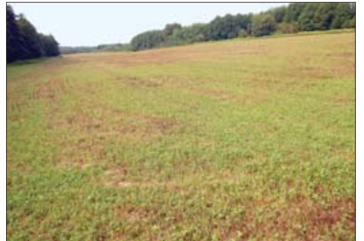
Vadlegelő-keverékes vadföld Bánokszentgyörgy térségében

Az Országos Magyar Vadászakamara 2018 őszén újra pályázati felhívást tett közzé, mely a korábbi célterületeken felül lehetővé tette a szántóföldi kultúrák vetésével történő apróvad táplálkozó- és búvóhelyeinek kialakítását is. Részvénytársaságunk ismét 6 pályázatot nyújtott be, az elnyert támogatás összege 4,63 millió forint. Élő pillangós vadlegelő-keverékes vadföldet 6 terü-